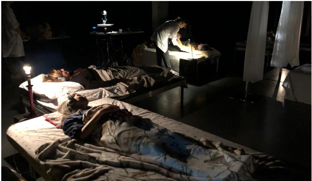
Résidence de création, Théâtre de la Ville.

Les deux performeur-euse-s, Klervi et Jonathan, interviennent dans l'espace de façon fantomatique, comme des soignant-e-s auprès des personnes couchées et de leurs proches recueillis à leur chevet. Le public entre en interaction avec une série de projections abstraites sur un écran central ou sur le mur du fond, en plus d'être en relation avec l'absent .