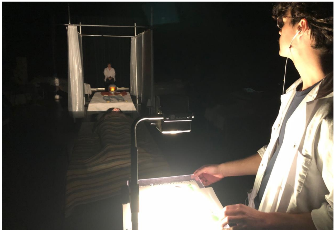
Résidence de création, Théâtre de la Ville. © Philippe Ducros (2024)

Le disparu – À la même époque, Klervi a eu accès au rapport d'autopsie de son frère. Elle a aussi commencé une démarche avec un groupe de soutien aux endeuillé·e·s. Au fil du temps, elle découvre comment l'art, la littérature en particulier, l'aide à (sur)vivre... Entre la lecture et l'écriture, elle tisse un peu de sens, renoue avec la création et le théâtre, et trace l'ébauche de certaines réponses. Les étapes du deuil sont en cours et cette œuvre en fait partie.