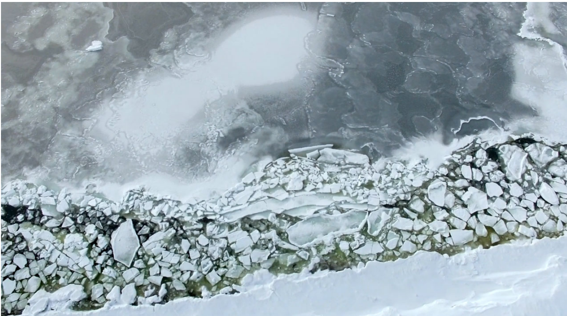
La banquise sur la route 138, entre Mani-Utenam et Pessamit.

— Anick Moulin, Vivement le retour, ICI Première (Estrie)