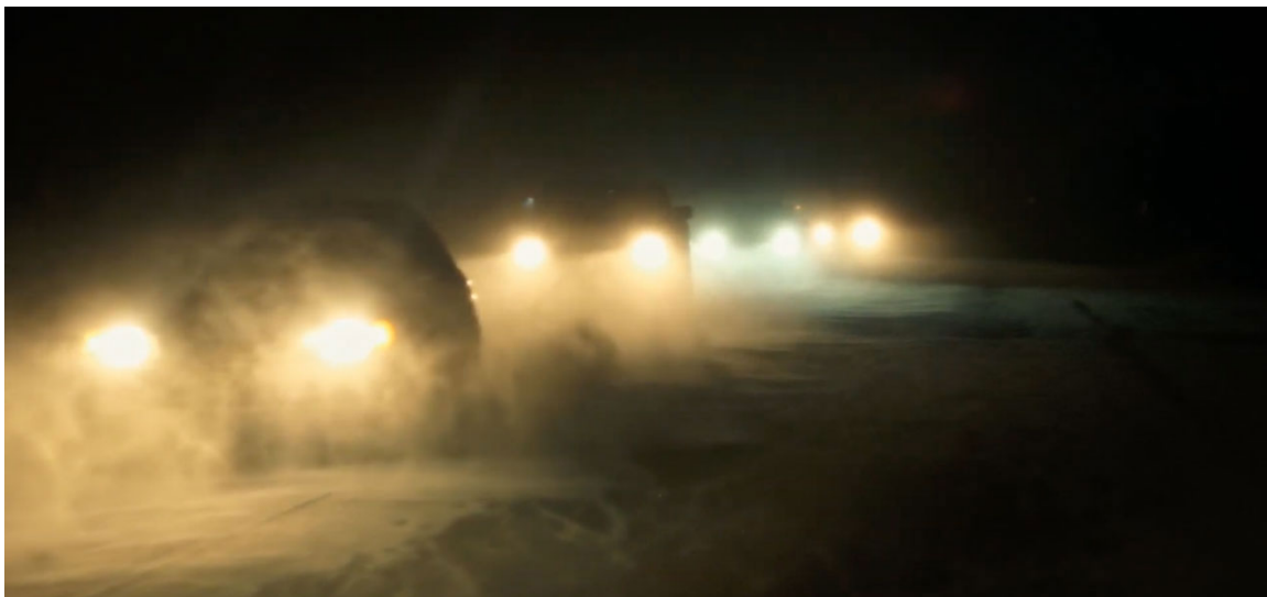
La route 132, près de Gesgapegiag.

Une production HÔTEL-MOTEL Avec la précieuse collaboration de PRIM