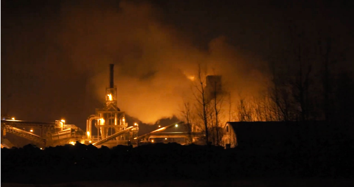
Le moulin de Résolu, aux abords de Mashteuiatsh.

Le terme « réserve » ne fait pas seulement allusion à ces bantoustans où l'on a stationné ces nations. Il fait aussi référence aux réserves naturelles qui sont derrière cette prise du territoire, cet océan d'arbres qui est actuellement coupé à blanc, parsemé de trous miniers abandonnés.