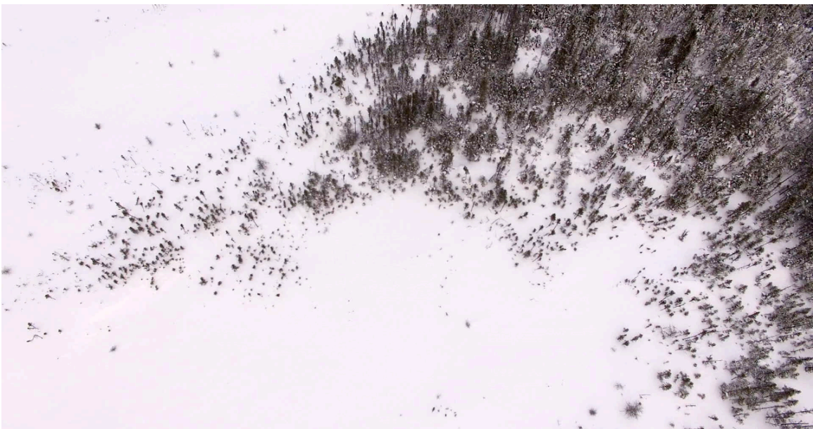
Épinettes noires, entre Mani-Utenam et Ekuanitshit.