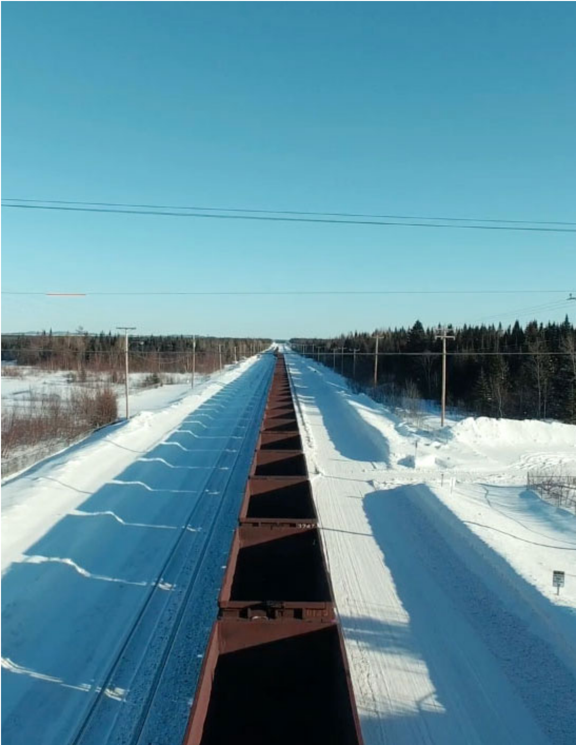
Train minier vers le Nutshimit.