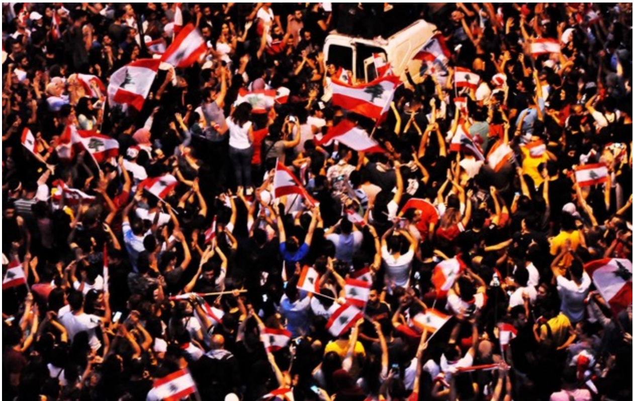
Beyrouth, Liban. © Philippe Ducros (2019)