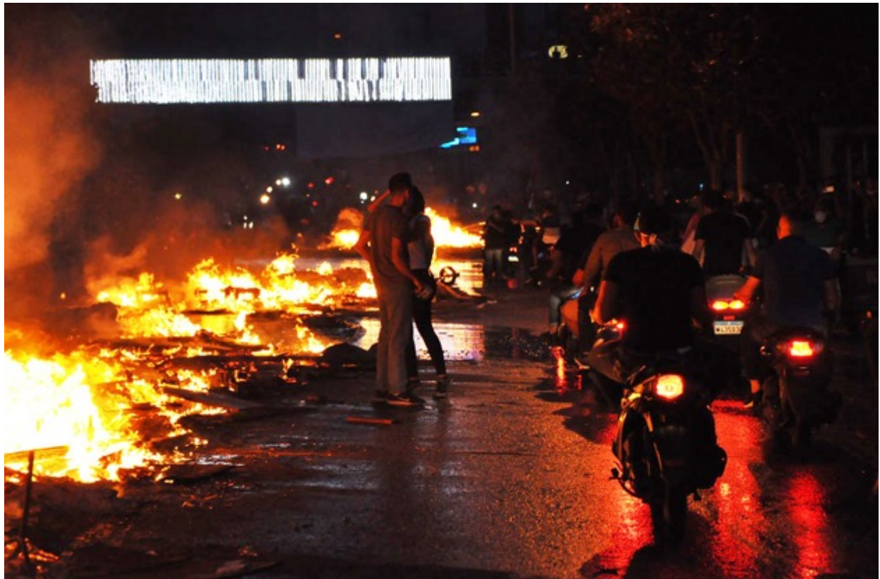
Beyrouth, Liban.

Quels sont les liens possibles entre la situation actuelle en Syrie, entre ses gens, sa guerre, et nous? Entre nos démocraties marchandes et le Moyen-Orient déstabilisé de façon si frontale depuis la fin de la guerre froide? Et comment avoir une lecture claire du monde et de ses enjeux souvent mortels quand les concepts de vérités sont si brouillés en cette ère post-factuelle?