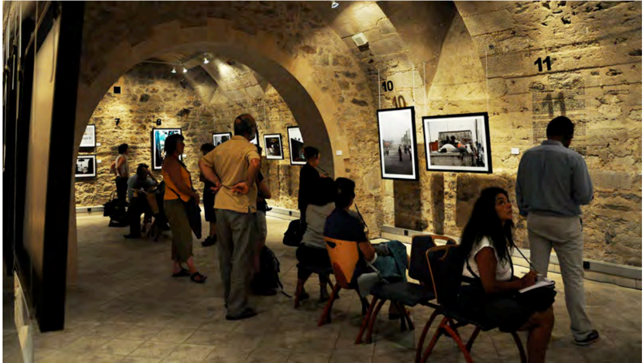
La Porte du non-retour au festival Les Francophonies en Limousin, 2011