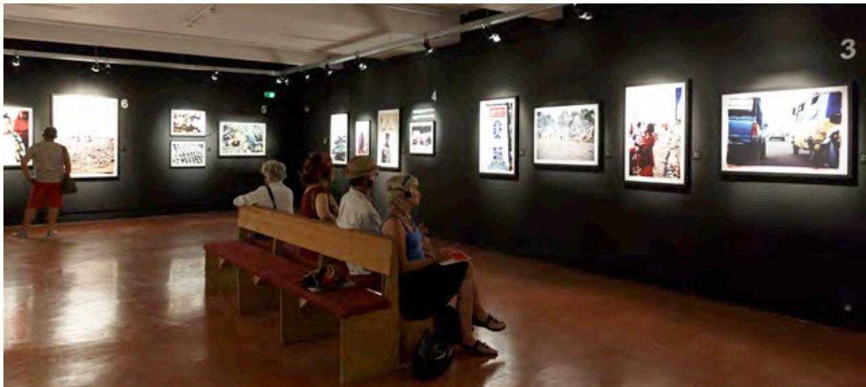
La Porte du non-retour au Festival d'Avignon, 2013